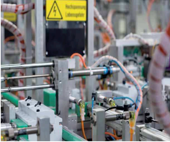
In vollautomatisierten Arbeitsschritten werden die Schalter einzeln geprüft.