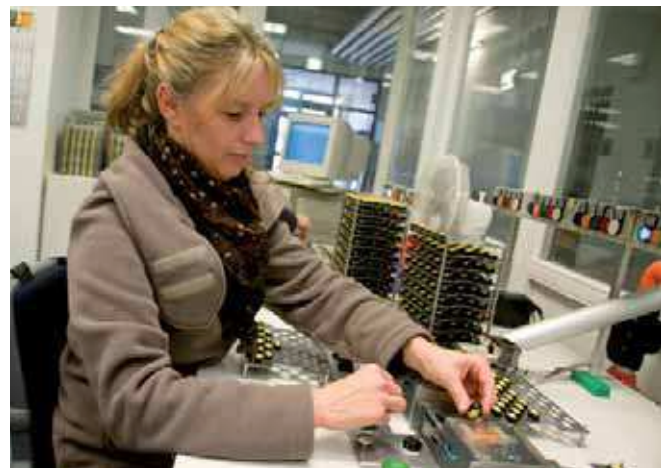
Einige komplexe Arbeitsschritte werden von Hand gemacht – zum Beispiel das Überprüfen des Auslöserelais.