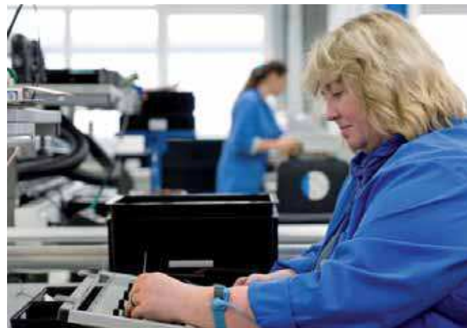
Um die Bauteile vor elektrostatischer Aufladung zu schützen, werden die Mitarbeiter am Handgelenk geerdet.