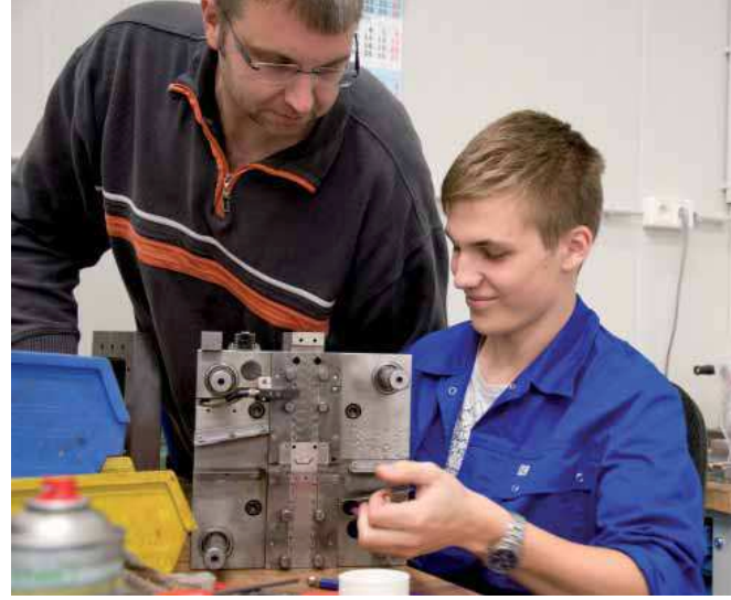
Im betriebseigenen Werkzeugbau werden Werkzeugmechaniker ausgebildet.