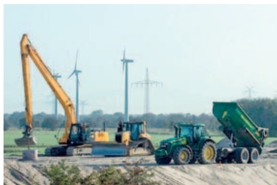
Umgehung: Die Ortsumgehung Schortens wird 2013 fertiggestellt