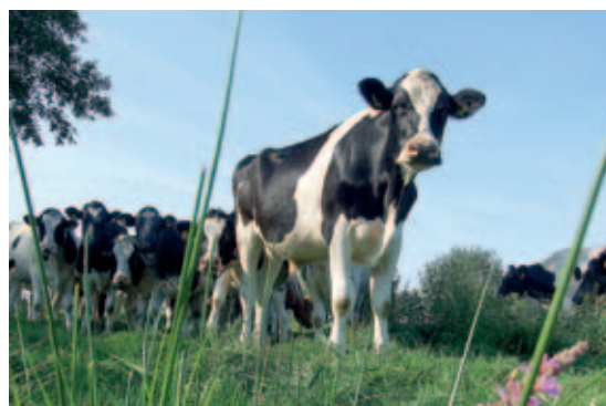
Kühe: Milchviehhaltung hat einen hohen Stellenwert in Wittmund