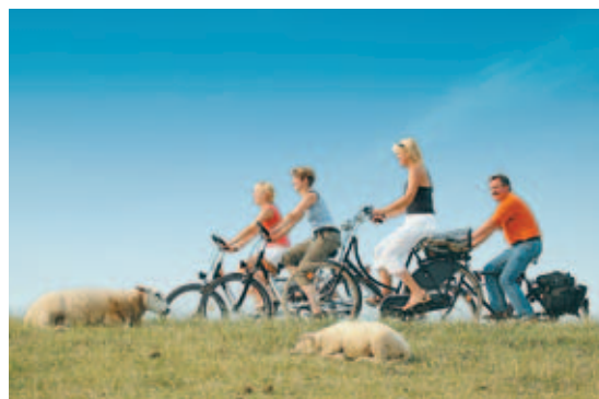
Drahtesel: Die ostfriesische Landschaft per Fahrrad erkunden