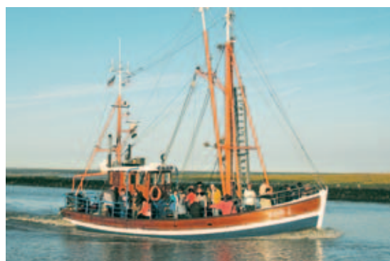
Wattenmeer: Das »Weltnaturerbe« hautnah erleben