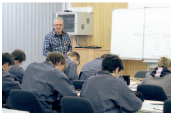
Ausbildung: Die Bundeswehr ist der größte Ausbilder im Landkreis