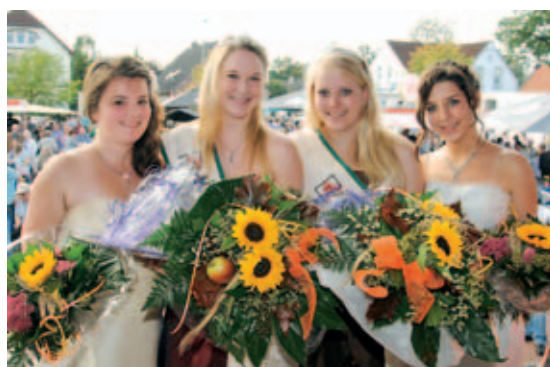
Festival: Buntes Treiben bei der Wahl des Friedeburger Burgfräuleins