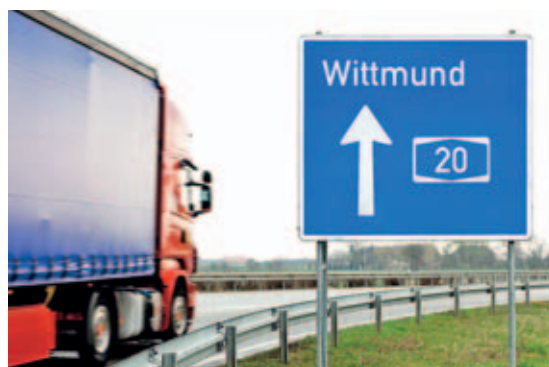
Autobahn: Die A 20 ist für Wittmund von zentraler Bedeutung