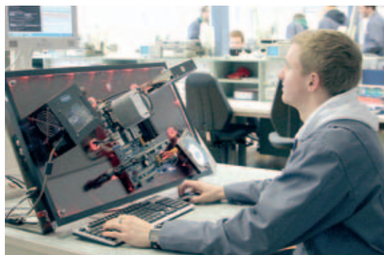
Informationstechnik: Die Ausbildungswerkstatt bildet im IT-Bereich aus