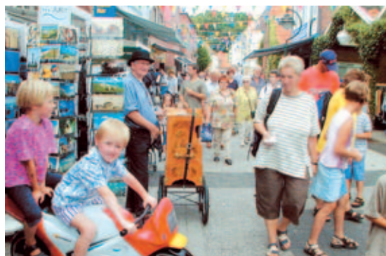
Stadtbummel: Viel los in der Esenser Innenstadt